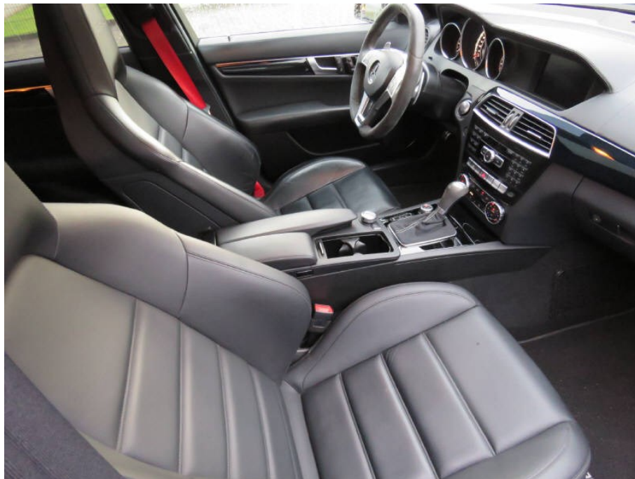
Bild 3 Innenraum vorne