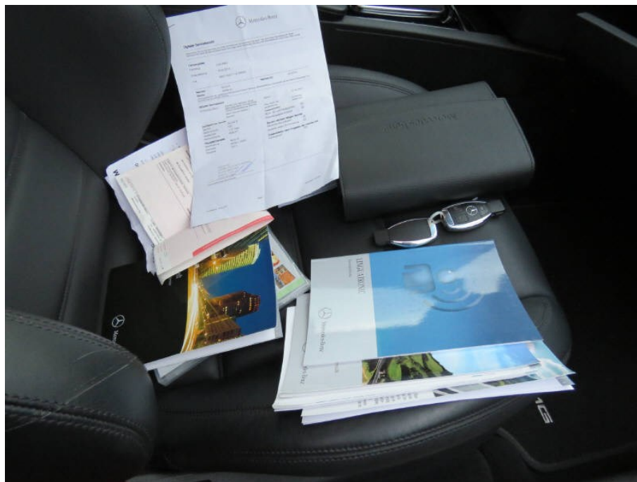
Bild 6 Bordmappe