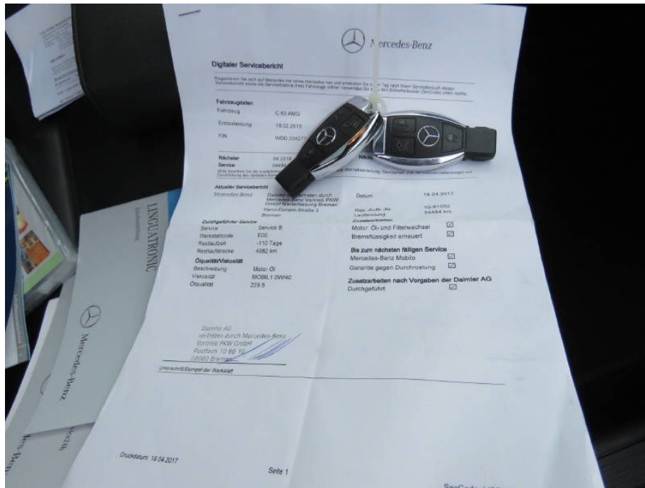
Bild 5 letzter Service