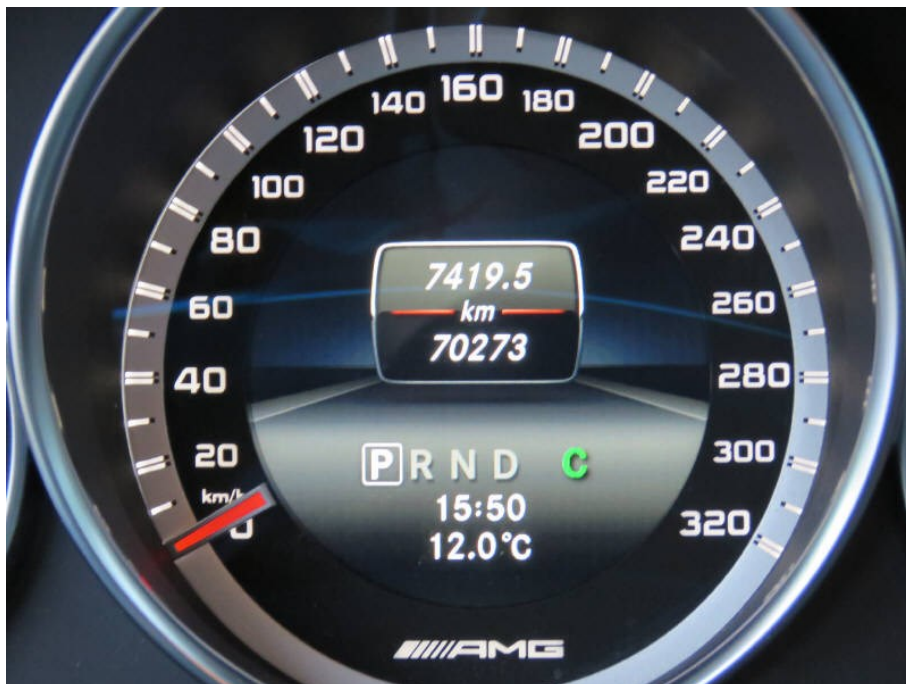
Bild 4 Tachostand