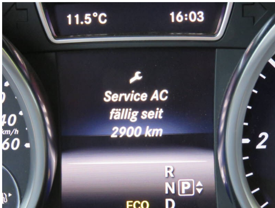
Bild 8 Service fällig