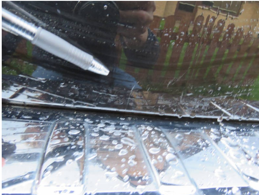
Bild 11 Heckklappe unterhalb verschürft