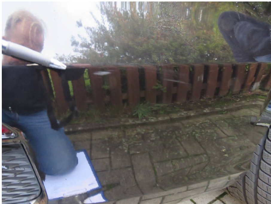
Bild 12 Stoßfänger hinten verkratzt