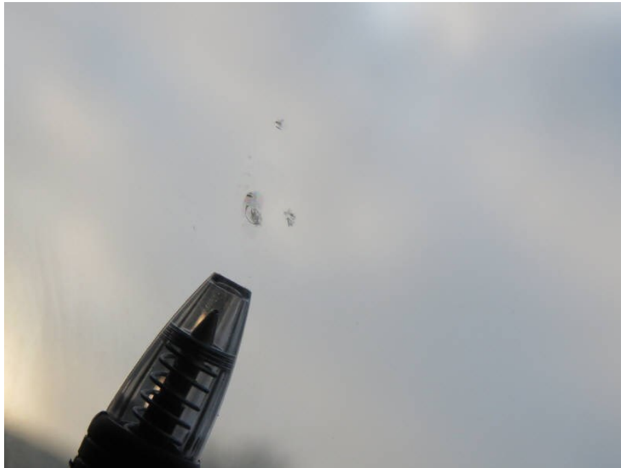
Bild 7 Frontscheibe Steinschlag mit Rissbildung